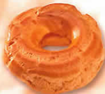
Paris Brest Ø 90 mm 11151 - Pur Beurre H: 35 mm / Poids net : 13,5 g