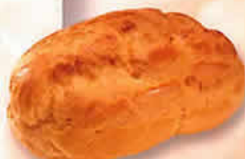
Gland Pâtissier 11041 - Standard 11141 - Pur Beurre Long. 91 mm / Larg. 68 mm H: 47 mm / Poids net : 11 g