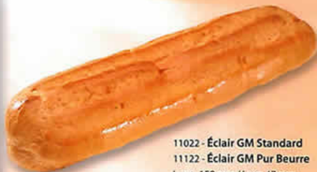
11022 - Éclair GM Standard 11122 - Éclair GM Pur Beurre Long. 158 mm / Larg. 47 mm H: 35 mm / Poids net : 13 g