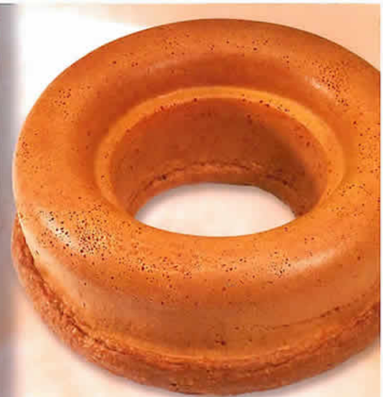
12107 - Baba Savarin Grand Modèle Ø 155 mm Pur Beurre H : 62 mm / Poids net : 95 g