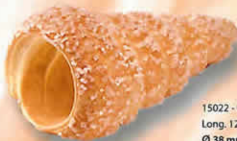
15022 - Cornet Sucré Long. 120 mm / Larg. 63 mm Ø 38 mm / H: 52 mm Poids net : 39 g