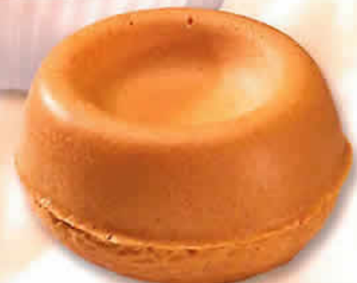
Babas Savarins Ø 61 mm 12101 - Pur Beurre sans caissette 12102 - Pur Beurre avec caissette 12001 - Standard sans caissette 12002 - Standard avec caissette H : 34 mm / Poids net : 13,5 g