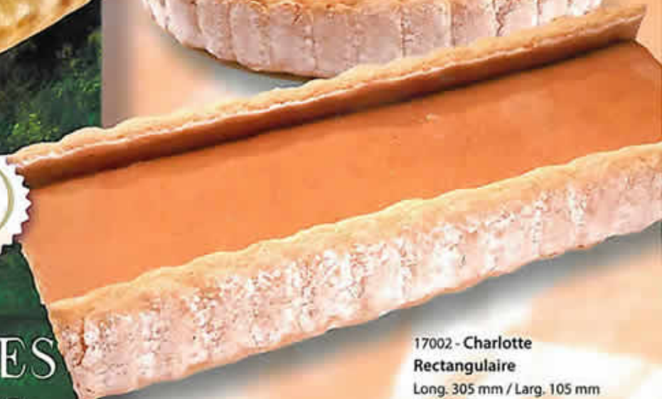
17002 - Charlotte Rectangulaire Long. 305 mm / Larg. 105 mm H: 45 mm Poids net : 200 g