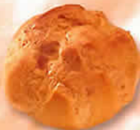
Chou Pâtissier Ø 75 mm 11001 - Standard 11101 - Pur Beurre H: 55 mm / Poids net : 11 g