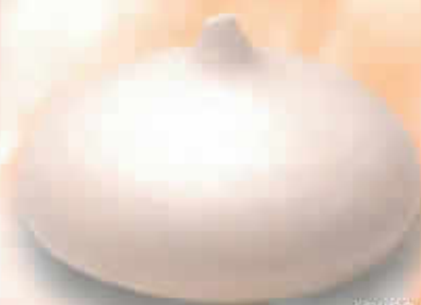
13001 - Meringue Coque