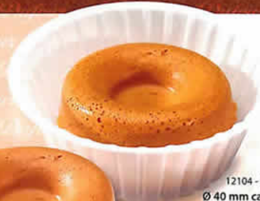
12104 - Baba Cocktail Ø 40 mm caissette Pur Beurre H : 25 mm / Poids net : 4 g