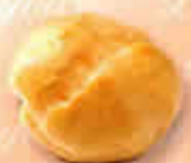
11140 - Chou Bille Ø 30 à 35 mm Pur Beurre H: 27 mm / Poids net : 1,5 g