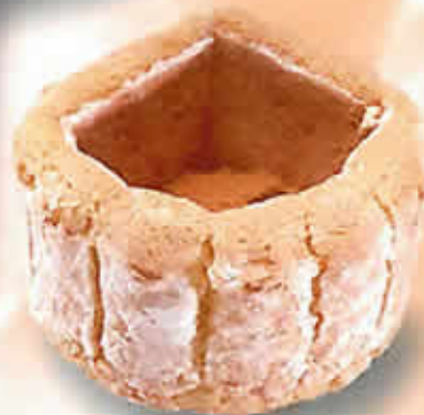
17000 - Charlotte Individuelle Ø 75 mm / H: 45 mm Poids net : 25 g