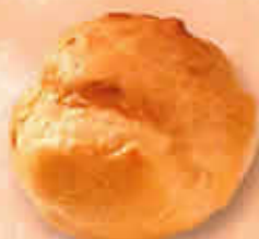
11103 - Chou Cocktail Ø 57 mm Pur Beurre H: 42 mm / Poids net : 4,7 g