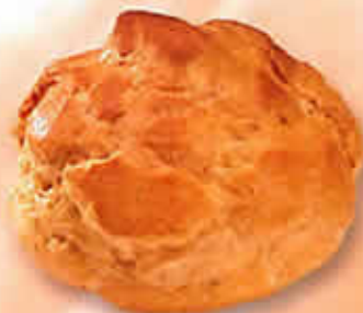
11102 - Chou GM Ø 86 mm Pur Beurre H: 57 mm / Poids net : 15,5 g