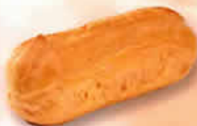
11123 - Éclair Lunch Pur Beurre Long. 67 mm / Larg. 30 mm H: 30 mm / Poids net : 3 g