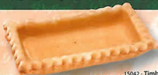
15042 - Timbale Feuilletée Rectangulaire Long. 115 mm / Larg. 65 mm H: 24 mm / Poids net : 14 g