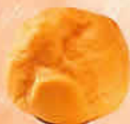
Mini Chou Profiterole Ø 45 mm 11005 - Standard 11104 - Pur Beurre H: 36 mm / Poids net : 3 g 11105 - Mini Profiterole Ø 40 mm Pur Beurre H: 30 mm / Poids net : 2,5 g