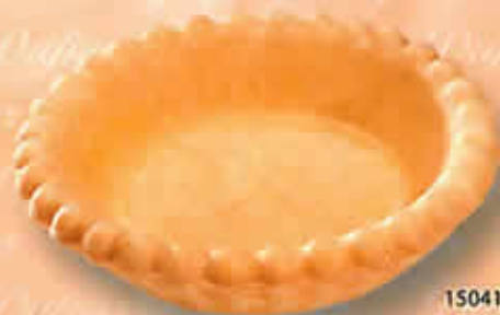
15041 - Tartelette Feuilletée Neutre Ø 85 mm H: 23 mm / Poids net : 10 g