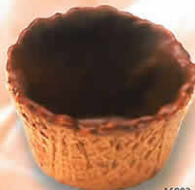
16002 - Coupelle Dessert