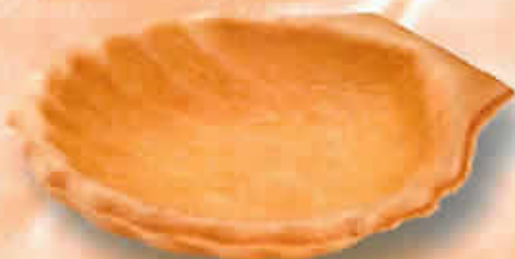
15043 - Coquille St-Jacques Feuilletée Long. 114 mm / Larg. 105 mm H: 24 mm / Poids net : 18 g