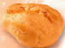
11142 - Mini Gland Pâtissier Pur Beurre Long. 55 mm / Larg. 38 mm H: 30 mm / Poids net : 2,6 g