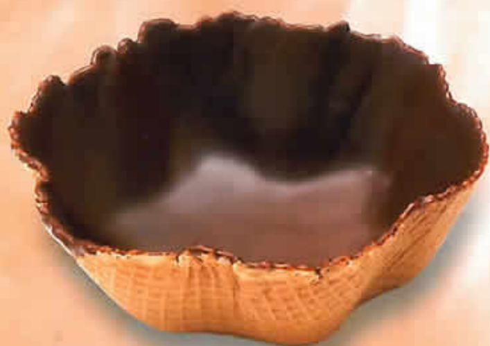
16001 - Coupe Dessert