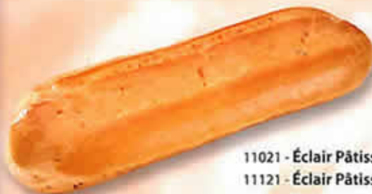
11021 - Éclair Pâtissier Standard 11121 - Éclair Pâtissier Pur Beurre Long. 130 mm / Larg. 45 mm H: 33 mm / Poids net : 9,5 g