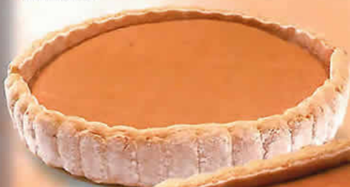
17003 - Charlotte Ronde Ø 260 mm / H: 45 mm Poids net : 280 g